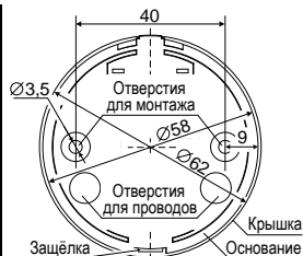
Рис.3 Задняя стенка. Расположение отверстий для монтажа. Присоединительные размеры

Величина оконечного резистора R ок определяется в соответствии с техническим описанием ППКП